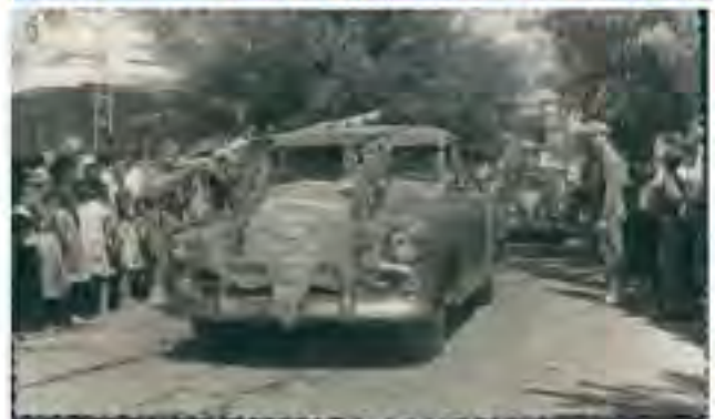
7 Eylül kutlamalarında resmi kurum ve meslek odalarının resmi geçit töreni