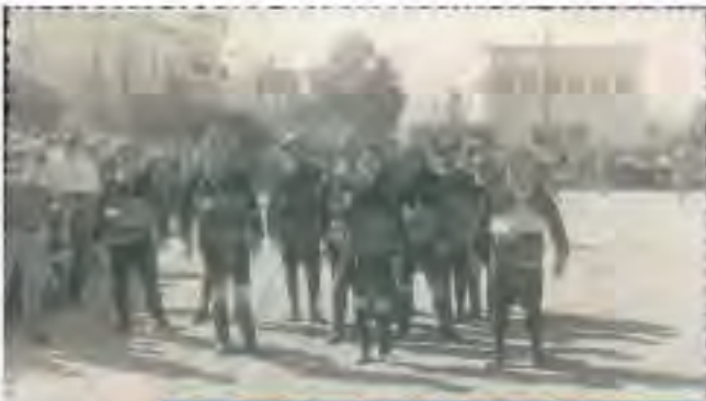
Aydın valilik önünde temsili kurtuluş bayramı törenleri

Yiğit efelerin oyunlarında, meydan inleyen davul zurnanın sesi, izleyen Aydınlı'nın milli duygularını coşturmağa yeterdi. Son gününde 7 Eylül Kurtuluş bayramının kutlandığı 4 gün süren kutlamalar süresince, kapalı spor salonunda düzenlenen konserler, İncir Güzeli yarışması, bir festival havası yaşanırdı. Özellikle esnaf odalarının araçla resmi geçitlerinde, halka dağıttığı eşantıyon, hediyelikler kapışılır, törenlere ayrı bir heyecan ve sevinç katardı,