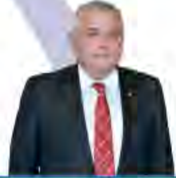
A. Bahri ERDEL Meclis Başkanı

2019-2020 zeytin zeytinyağı sezonunun hayırlı ve bereketli olmasını temenni ediyorum.