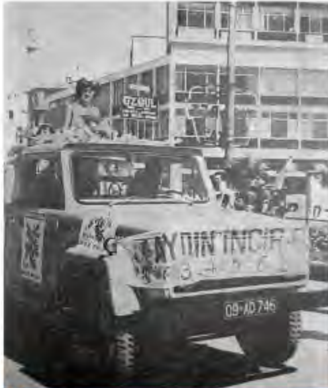
İncir güzeli, İstasyon meydanında, kortej arabesinden halo selamlaşma geçidi

İşte yıllar önce 1973 yılından seçilen bir İncir güzelinin İstasyon meydanında kortej geçidinden bir anı.