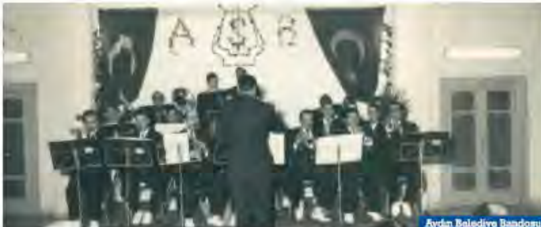
Aydın Belediye Bando

Aydın'ın en uzak köy ve kasabalarından gelenler, kentin birçok noktasında devam eden ve yaz akşamları, fener alayları, konserler, çeşitli zeybek oyunları ve belediye orkestrasının resmi geçidi ile geceleri verdiği konserler daha da şenlenirdi. Askeri bando geçidi, Fener alayı eşliğinde alkış tufanı ile karşılanırdı. AYDIN BELEDİYE BANDOSU günün popüler parçalarını çalar konserler verirdi