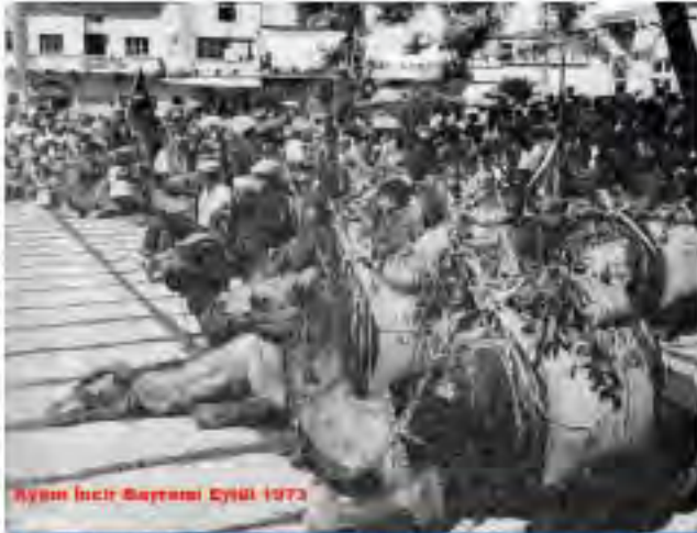
Aydın İncir Bayramı Eylül 1973