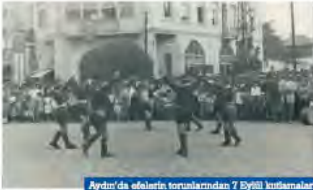
Aydın'da efelerin torunlarından 7 Eylül kutlamaları

Halkın tek eğlencesi olan bu bayramın, yerelde kahramanlıkların anılması ile, kuvvayı milliye ruhunun tekrar canlanmasına vesile olurdu. 7 Eylül Kurtuluş bayramı 4 gün devam eden öncesindeki kutlamalar, Valilik önünde temsili Yunan kuvvetlerinden kentimizin kurtuluşunun gösterileri ile başlardı.