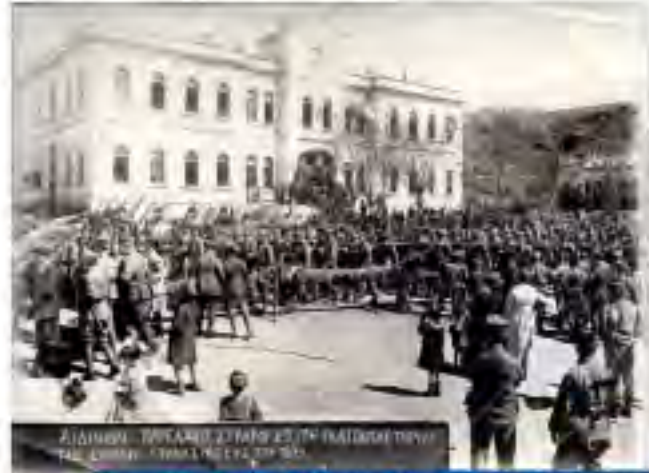
Tunan Askerleri İşgali Altında Aydın Hükümet Konağı (1919)

Düşman, işgali altında acı ve çile içinde geçen 1919-1922 yılları arasında 40 ay boyunca Aydın kurtarılmayı beklediği sonunda, onurlu bir mücadele sonucu işgal yıllarının ardından, geri kazanılan kentimizin, özgürlüğü ve işgalin sona erdiği, acıların dindiği kurtuluşun adıdır 7 Eylül...!