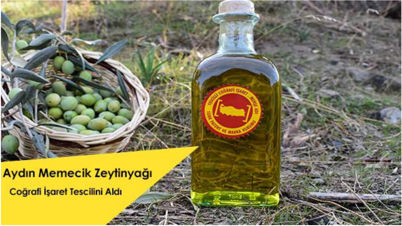
Aydın Memecik Zeytinyağı Coğrafi İşaret Tescilini Aldı

A ydın ilinin önemli tarımsal ürün değeri olan zeytinyağının, “Aydın Memecik Zeytinyağı” olarak Türk Patent ve Marka Kurumu’na 2019 yılında başvurusu yapılmış olup 2020 yılında tescili gerçekleşti.