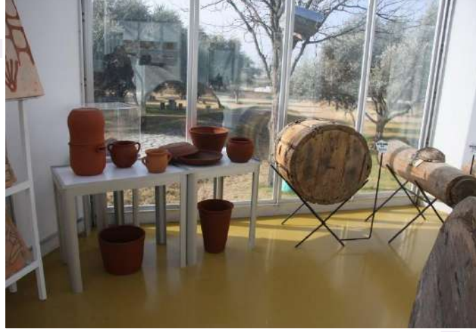
ÇİNE ARICILIK MÜZESİ

Arcılığın geçmişten izlerinin bulunduğu, Arı ve arıcılığı gelecek nesillere sevdirebilen, Arcılarımıza teknik bilgileri doğru ve uygulamalı olarak aktarabilen, Arı ürünlerinin kullanımı teşvik ederken, tüketici bilincine katkı sağlayan, Kendini her gün geliştiren, dinamik bir müze hedefleriyle Yağcılar Köyü İlköğretim Okulu T.C. Milli Eğitim Bakanlığınca Adnan Menderes Üniversitesine 10.03.2012 tarihinde tahsis edilmiştir. Türkiye'nin ilk, Dünyanın 71'inci arıcılık müzesi olan Çine Arıcılık Müzesi 4.10.2010 tarihinde törenle hizmete girmiştir.