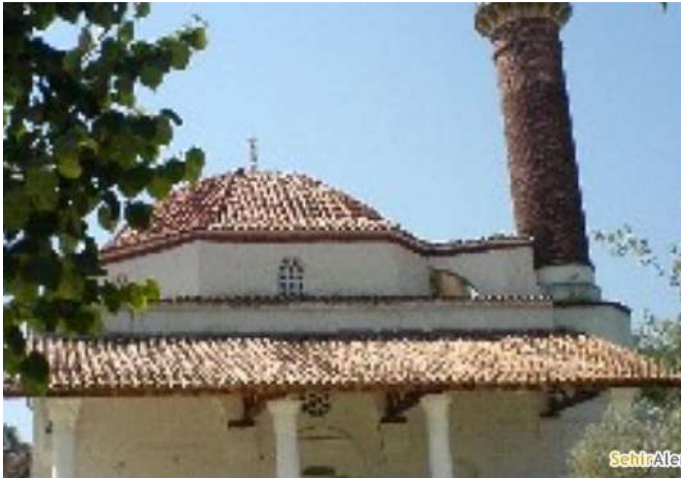
YAVUZKÖY ŞEMSİ PAŞA CAMİİ

Yavuzköy Şemsi Paşa Camii, Köşk ilçesi sınırları içinde Osmanlı döneminden günümüze kadar gelebilmiş önemli eserlerden biridir. Yavuzköy Şemsi Paşa Camii'nin 1654 yılında Aydın'daki Şemsi Paşa Camii ile birlikte Ahmet Şemsi Paşa tarafından yaptırıldığı rivayet edilir.