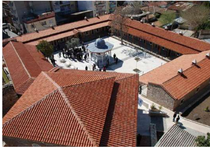
NASUH PAŞA KÜLLİYESİ

Külliye'nin batısında, hamamın doğusundaki yapı, halk arasında Osman Ağa Medresesi ismiyle de anılmaktadır. Medrese, kareye yakın bir avlu etrafında sıralanan tek katlı ahşap kapılı kare planlı moloz taş ve tuğladan inşa edilmiş odalardan meydana gelmektedir.