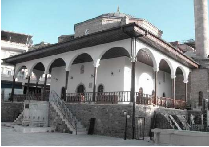
KOÇARLI CİHANZADE MUSTAFA CAMİİ

Hacı Mustafa Ağa Camii adıyla da anılmaktadır. Koçarlı kent merkezinin en eski camisidir. Çarşı içerisinde merkezi bir konuma sahiptir. 17. yüzyılın ikinci yarısında (1753-1756) yapıldığı bilinmektedir. Birincisi 1850'li yıllarda olmak üzere birkaç defa onarım geçirmiştir. Ön revak bölümünde iki yönlü ve 11 basamaklı merdiven bulunmaktadır.