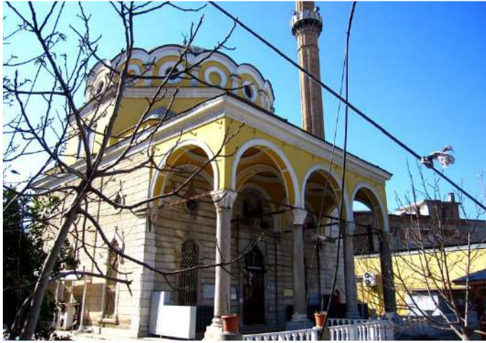
RAMAZAN PAŞA CAMİİ

Cami, kesme taştan 11x11 m ölçüsünde kare planlıdır. Son cemaat yeri dört yuvarlak sütunun taşıdığı üç kubbe ile örtülüdür. Giriş kapısı mermerden olup, Osmanlı taş işçiliğinin örneklerindedir. İbadet mekânı üç sıra halinde onar pencere ile aydınlatılmıştır. Ayrıca kubbe kasmağında on altı penceresi bulunmaktadır. Minberi mermerden olup, işlemelidir. Mihrabı da yine oymalı mermerdendir. Tek şerefeli minaresi caminin sağ tarafındadır. Caminin minaresi 1899 yılında yıkılmıştır. Cami Kurtuluş Savaşı sırasında zarar görmüş ve Cumhuriyet döneminde yeniden yapılmıştır.