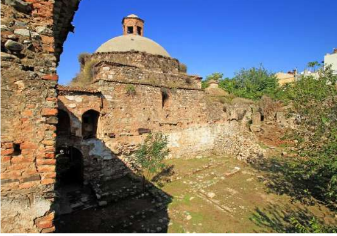
GÜMRÜK ÖNÜ HANI

Gümrük Önü hamamı bitişiginde yer alan han, hamamla çağdaş olup iki kanadı tamamen yıkılmıştır. Günümüze dek hanın batısındaki bölüm ile güneyindeki mekânların bir kısmı ayakta kalabilmeyi başarmıştır.