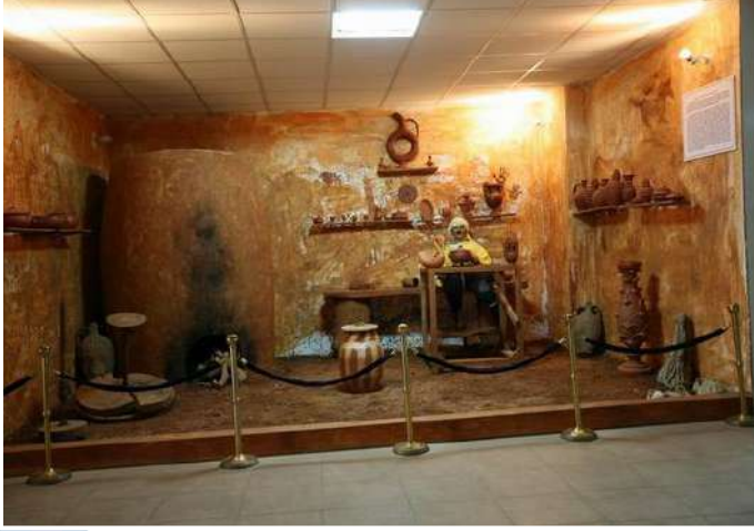
KARACASU ETNOĞRAFYA MÜZESİ

Karacasu Etnoğrafya Müzesi, Karacasu İlçe Merkezinde Tavas Yolu üzerindedir. Aphrodisias Müzesi Müdürlüğüne bağlı olarak 2007'de ziyarete açılan müzede ilçenin geçmişten günümüze seramik, sıcak demir, deri ve diğer el sanatları ile ilgili etnografik eserleri sergilemektedir.