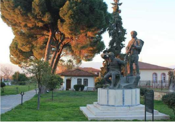
YÖRÜK ALİ EFE MÜZESİ

Kahraman Yörük Ali Efe'nin İzmir'den dönüşünden ölümüne kadar yaşadığı Yenipazar ilçe merkezindeki evi 1980'li yıllarda çıkan yangında tamamen yanmıştır. 1995 yılında Aydın Valiliğince Kültür Bakanlığına yapılan öneri kabul görmüş, Yörük Ali Efe'nin mirasçıları evin müze yapılması koşulu ile evi Kültür Bakanlığına bağışlamışlardır.