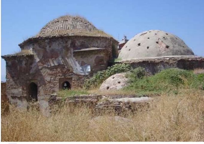
CEMAL BEY HAMAMI

"Bey Hamamı" olarak da anılan yapı, Nasuh Paşa Külliyesi'nin biraz ilerisinde, doğuda yer alır. Günümüzde oldukça harap haldedir. İnşasında tuğla ve taş malzeme bir arada kullanılmıştır. Yapının içindeki izlerden süslemeli olduğu anlaşılmaktadır. Soyunmalığın batı girişi üzerindeki kitabesine göre yapı Abdülaziz adlı bir zat tarafından H.1177/M.1763 yılında onarılmıştır. Buna göre yapının 18. Yy'ın başlarında inşa edildiğini düşünmek mümkündür.