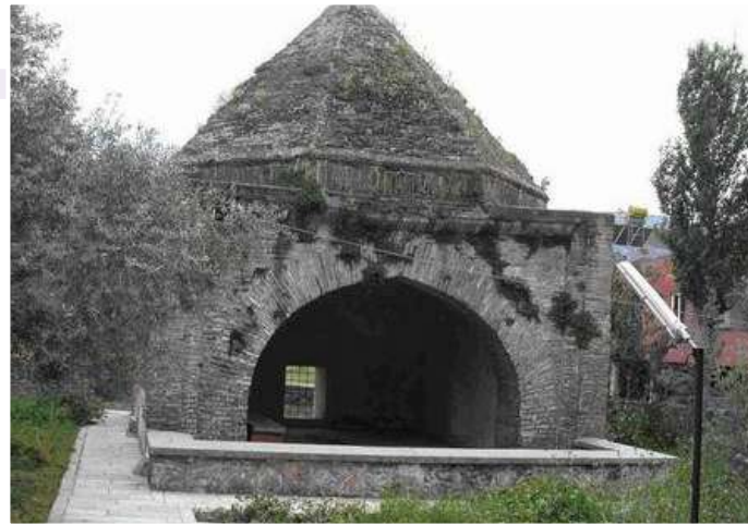
AHI BAYRAM (AHI İBRAHİM) TÜRBESİ