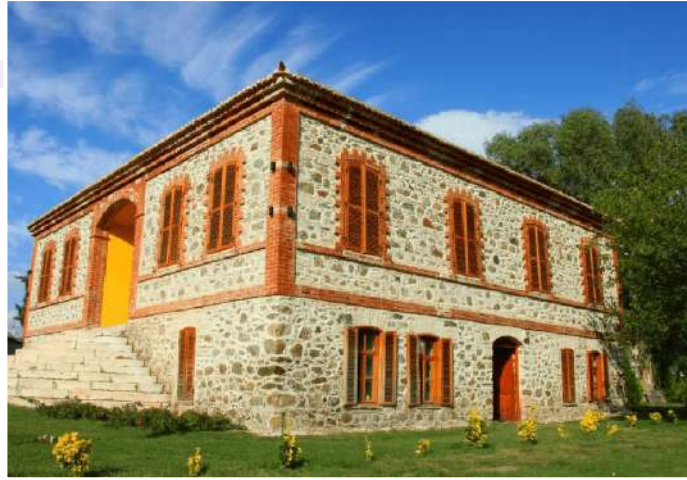
KUVAY-I MİLLİYE MÜZESİ

Sultan Abdülhamid Han tarafından 1906-1909 yıllarında yaptırılan, daha sonra 1919-1979 yılları arasında Çine Askerlik Şubesi olarak hizmet veren bina, Kuva-yı Milliye Müzesi olarak restore edilerek hizmete açıldı. Kurtuluş Savaşı öncesi Aydın'da savaşa katılmak için Muğla'dan Çine'ye gelen vatandaşların da toplanma merkezi olarak bilinen Çine Askerlik Şubesinde, Güney Cephesinin Yunan işgalinden kurtuluşunun planları yapılmıştı.