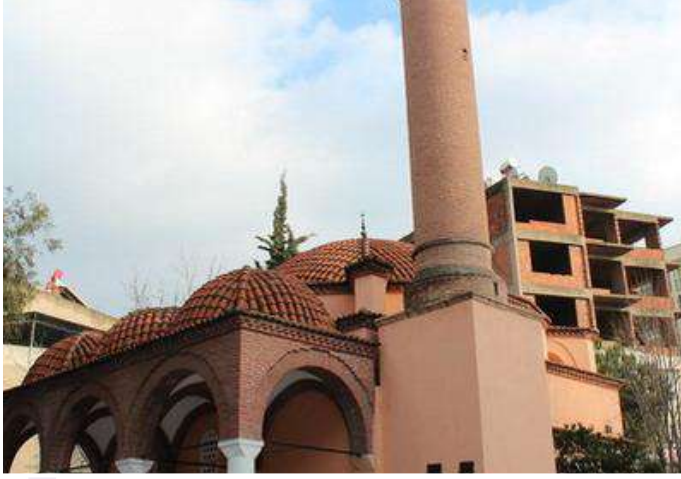
AHMET ŞEMSİ PAŞA CAMİİ

Halk arasında Kırmızı Minareli Camii olarak da bilinmektedir. Ahmet Şemsi Paşa tarafından 1659 yılında yaptırılmıştır. Kare planlı son cemaat yerine sahip, tek kubbeli, tek minareli bir camiidir. Tuğla minaresinden dolayı kırmızı minareli camii ismi verilmiştir.