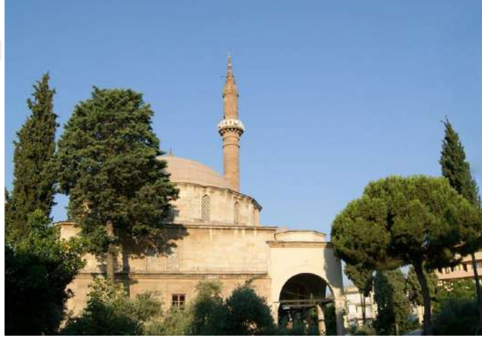
ESKİ YENİ CAMİİ

Aydın Gazi Bulvarı üzerindedir. Mısır Beylerbeyi Üveys Paşa'nın kardeşi Hasan Çelebi tarafından 1585 yılında yaptırılmıştır. Hasan Efendi Camisi olarak tanınan bu cami, Kurtuluş Savaşı'ndan sonra yenilenmiş, bu yüzden de Eski-Yeni Cami ismi halk tarafından verilmiştir.