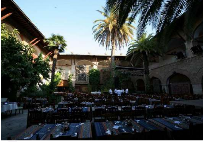
ÖKÜZ MEHMET PAŞA KERVANSARAYI

Kuşadası İskelesi yakınındadır. 1618 yılında Sadrazam Öküz Mehmet Paşa tarafından yaptırılmıştır. Kalın ve yüksek duvarların çevrelediği dikdörtgen avlunun etrafında iki katlı, revaklı kapalı mekan vardır. Moloz taş ve devşirme taş malzeme kullanılarak inşa edilmiştir. Küçük bir iç kale görünümünde olan kervansaray, en üst kısmı üçgen uçlu, sivri dentedir. Geniş avlu etrafında sıralanmış odalar vardır.