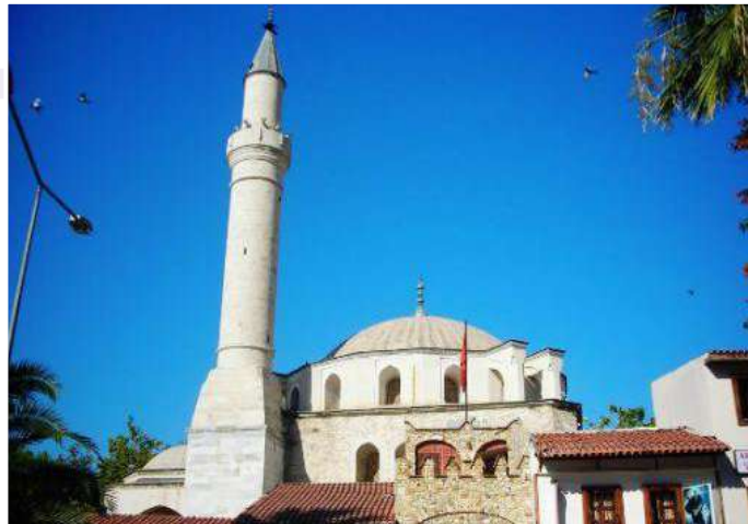
ÖKÜZ MEHMET PAŞA CAMİİ (KALEİÇİ CAMİİ)

Kaleiçi Camii olarak bilinen Öküz Mehmet Paşa Camii 7.yy ilk çeyreğinde yaptırılmıştır. Kesme taştan yapılmış, sade Osmanlı mimarisinin güzel bir örneği olan Kaleiçi Camii, Kuşadası'nın en eski camisidir.