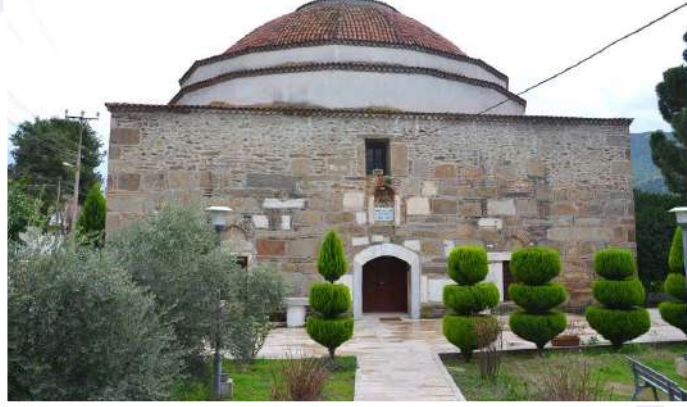
AHMET GAZİ CAMİİ

Aydın Çine'ye bağlı Eski Çine Köyü'nde bulunan Ahmet Gazi Camii (Ulu Cami) Miladi 1308 yılında (XIV. yy'in ilk yarısı) inşa edilmiştir. İnşaatı hakkında ayrıntılı bilgiler bulunmamaktadır. Tarihi belgelere bakıldığında Camii'nin Menteşeoğlu Orhan Bey döneminde, oğlu Hızır Bey tarafından yaptırılmış olması kuvvetle muhtemeldir. Ancak XIV. yy'in ikinci yarısında Camii Menteşeoğlu İbrahim Bey'in oğlu Ahmet Gazi Bey (1366'da Menteşe Bey'i oldu, 1390 yılında vefat etti.) tarafından iyileştirilerek tekrar canlandırılmıştır.