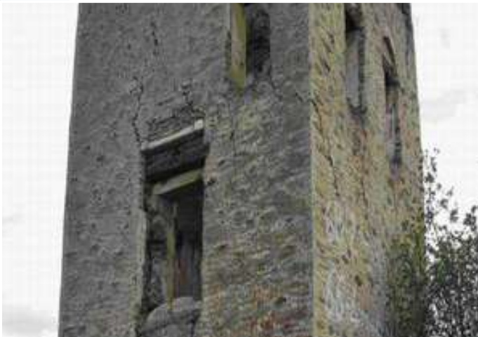
BEYLER KULESİ (DONDURAN)

Aydın ilinin Yenipazar İlçesi Donduran Köyünün güneyinde yer almaktadır. Moloz taş tuğla ve yer yer mermer spoilen malzemedен inşa edilmiştir. Birbirine bitişik iki kare mekandan oluşan kulenin batı cephesine bitişik kare mekan daha küçük ebatlardadır.