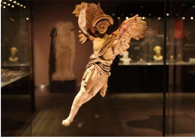
AYDIN ARKEOLOJİ MÜZESİ

Milet Müzesi teşhir alanları; bahçe teşhiri ve kapalı alan teşhiri olmak üzere iki ana bölümden oluşur. Bahçe teşhirinde Milet şehir sembolü olan aslan heykelleri, yazıtlar, mezar stelleri, lahitler, mimari elemanlar ve sütun başlıkları sergilenmektedir. Kapalı teşhir alanı Müze idari bina içerisinde yer alır. Yaklaşık 600 m 2 'lik alanda Milet Antik Kenti, Priene Antik Kenti ve Didim Apollon Tapınağı buluntuları sergilenir.