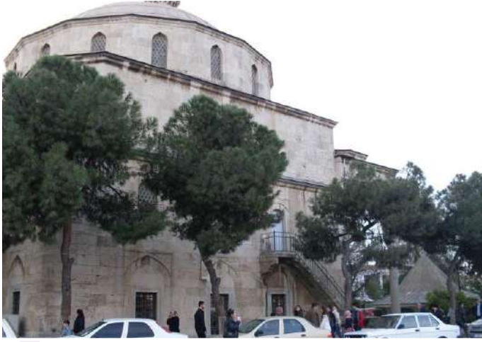
SÜLEYMAN BEY CAMİİ